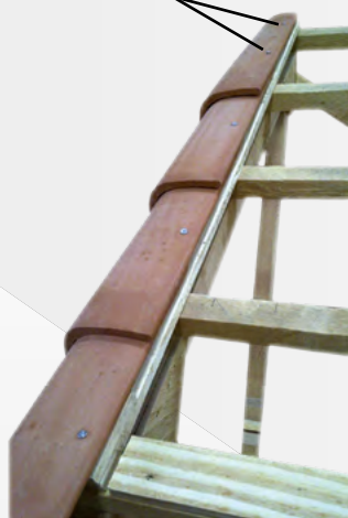
Rive ronde sans barette

Toutes nos rives sont préperçée de 2 trous