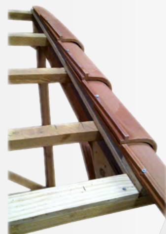
Rive ronde avec barette

Nouvelle forme pour une étanchéité renforcée