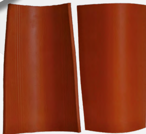
Canal coupée de départ sans butée